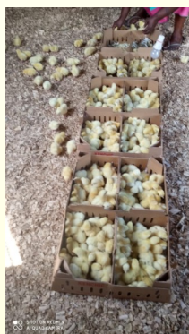
I pulcini e il cibo al loro arrivo