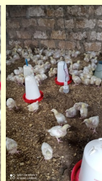
Dopo due settimane come sono già cresciuti !